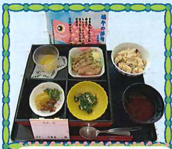
端午の節句行事食

見た目、香り、食感、味等色々なことを味わうことができるよう工夫しました。楽しんでいただけたのであれば幸いです。これからも季節や行事に合わせたお食事を提供しみなさまにお食事を味わい楽しんでいただけたら幸いです。